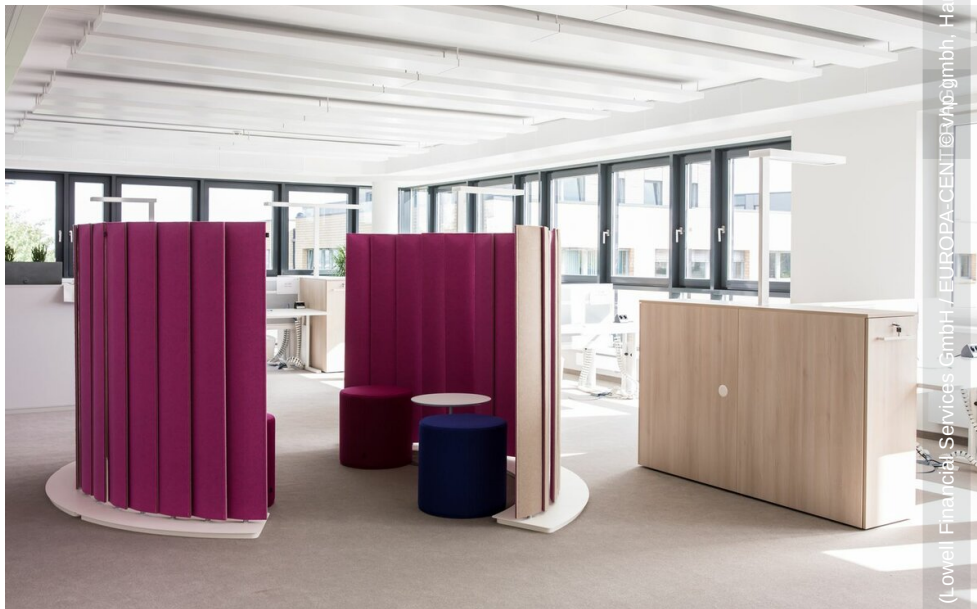
(Lowell Financial Services GmbH / EUROPA-CENTER AG)