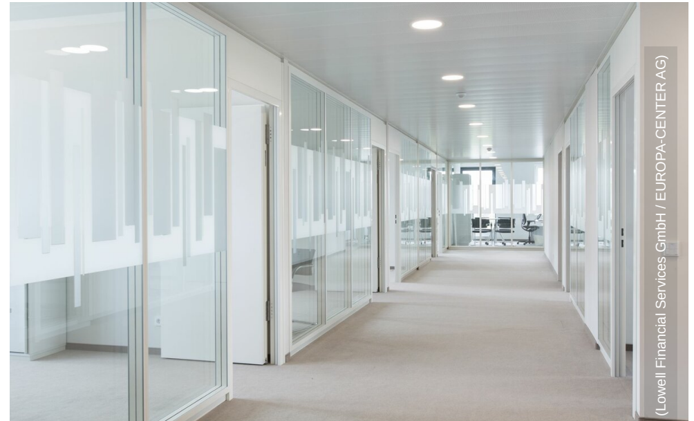
(Lowell Financial Services GmbH / EUROPA-CENTER AG)