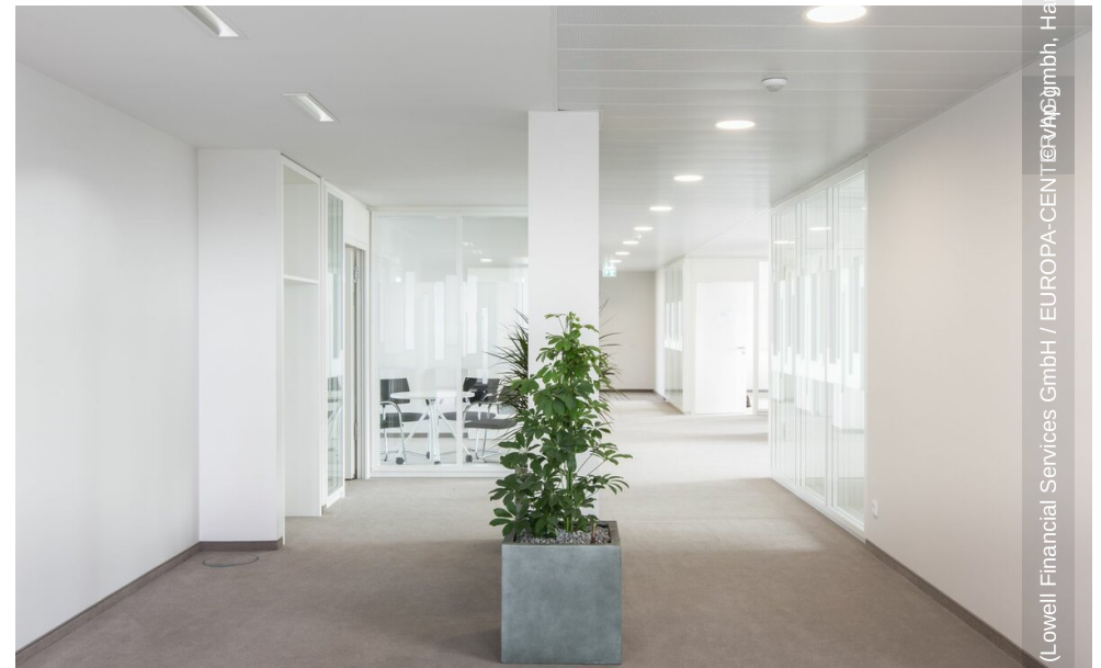
(Lowell Financial Services GmbH / EUROPA-CENTER AG)