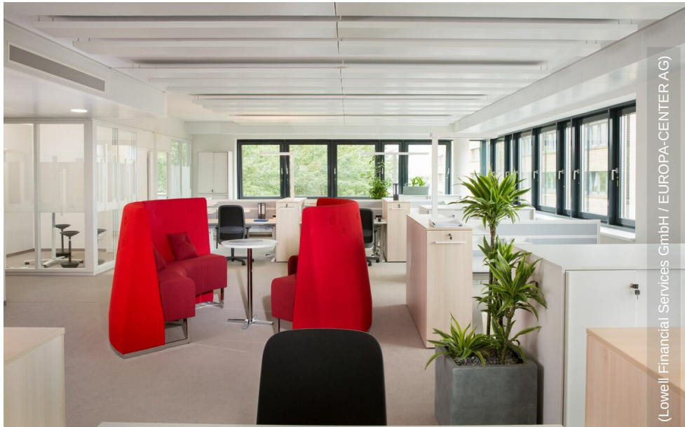
(Lowell Financial Services GmbH / EUROPA-CENTER AG)